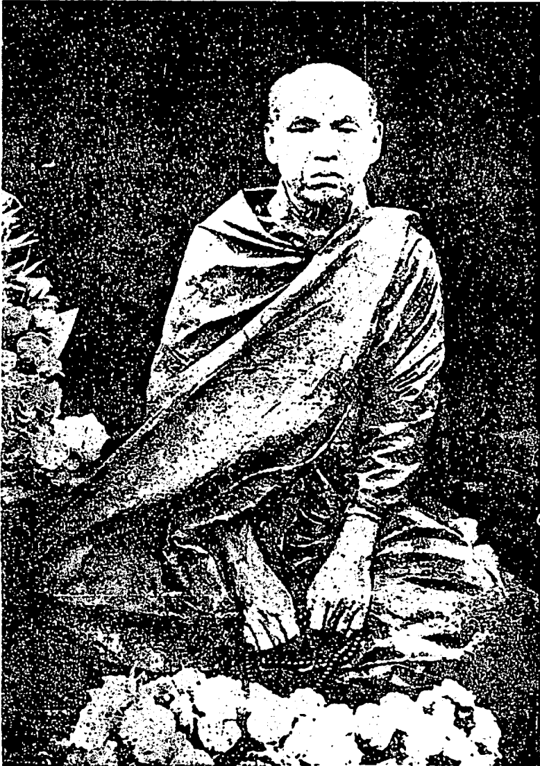
ကျေးဇူးရှင် လယ်တီဆရာတော်ဘုရားကြီးပုံတော်